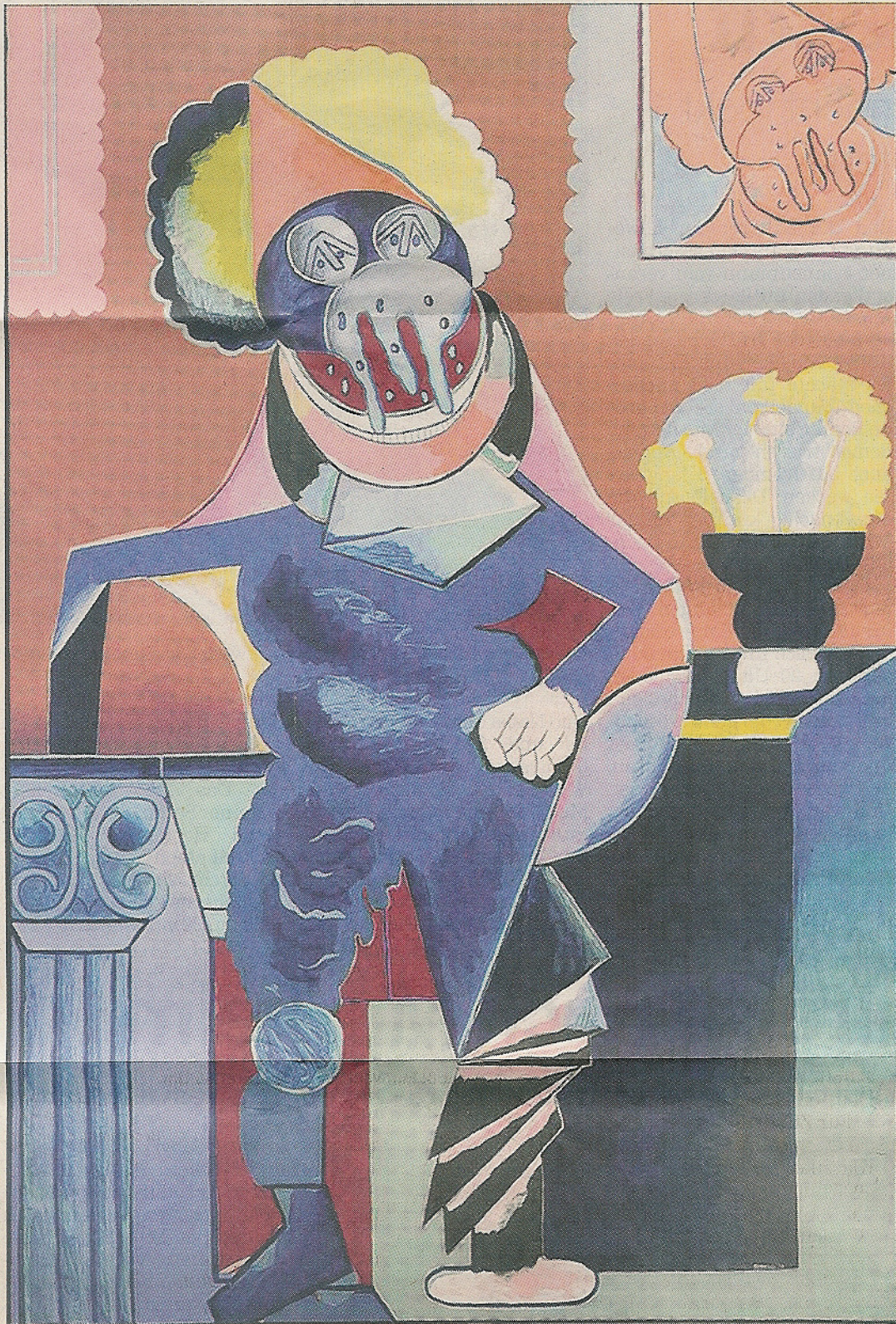
Ironisch: Gordillos „Kubistischer Ritter in Tränen“.

stellung soll an Filmtechniken erinnern – Drehen, Schneiden, neue Zusammenhänge herstellen. Ich wollte etwas Ähnliches wie im Film machen, so dass die Handlung vor oder zurück gehen kann.“ Gordillo gilt als einer der Wegbereiter der Pop Art in Spanien. Über die Rückkehr zum Figürlichen