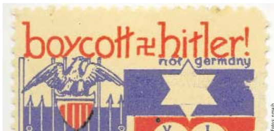
Form und Inhalt: das Gebäude (o.), Protestbriefmarken gegen Hitler (1933) und gegen die Unterdrückung der sowjetischen Juden (1980), Zigarettenbild mit dem Boxer Charlie Goldman (u.l.)