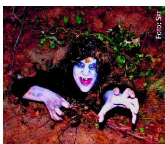
Horror pur: Untoter im Maisfeld des Hawkshaw Farm Park

Typisch englisch. Es genügt nicht, dass ein Maisfeld zum Labyrinth wird, in dem man sich verlaufen kann. Nein, dieses Maisfeld wird allnächtlich zur Geisterbahn: „Hex in the Harvest“ ist das Motto im Hawkshaw Farm Park in Lancashire in Nordengland. Und damit sich niemand allein gruseln muss, suchen die Besucher in Zehnergruppen den Weg durchs Mais.