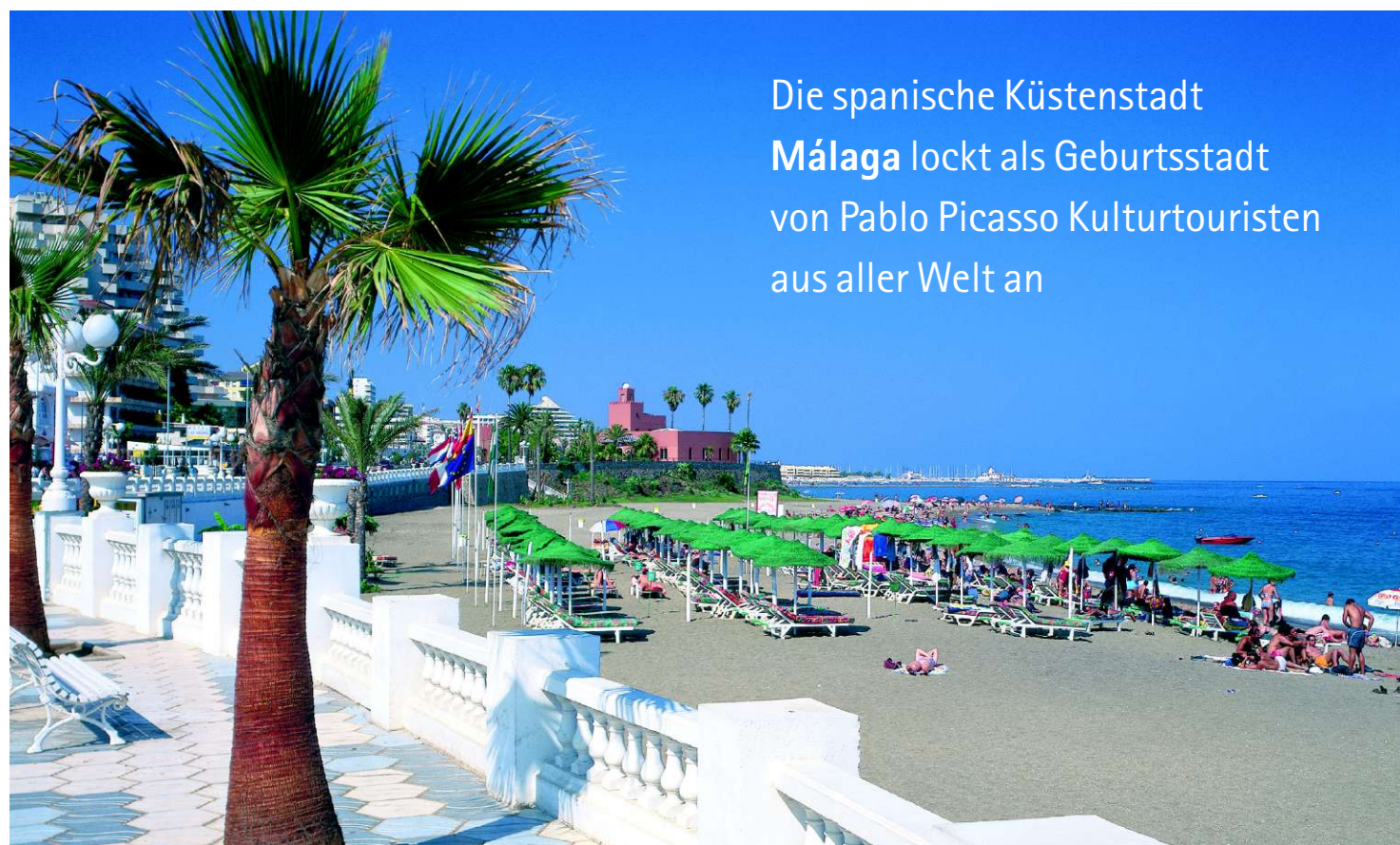
Málaga: Strandpromenade (oben); Picasso-Geburtsort (rechts); der Künstler und eine Skulptur, die im städtischen Museum zu sehen ist (unten)

Die spanische Küstenstadt Málaga lockt als Geburtsstadt von Pablo Picasso Kulturtouristen aus aller Welt an