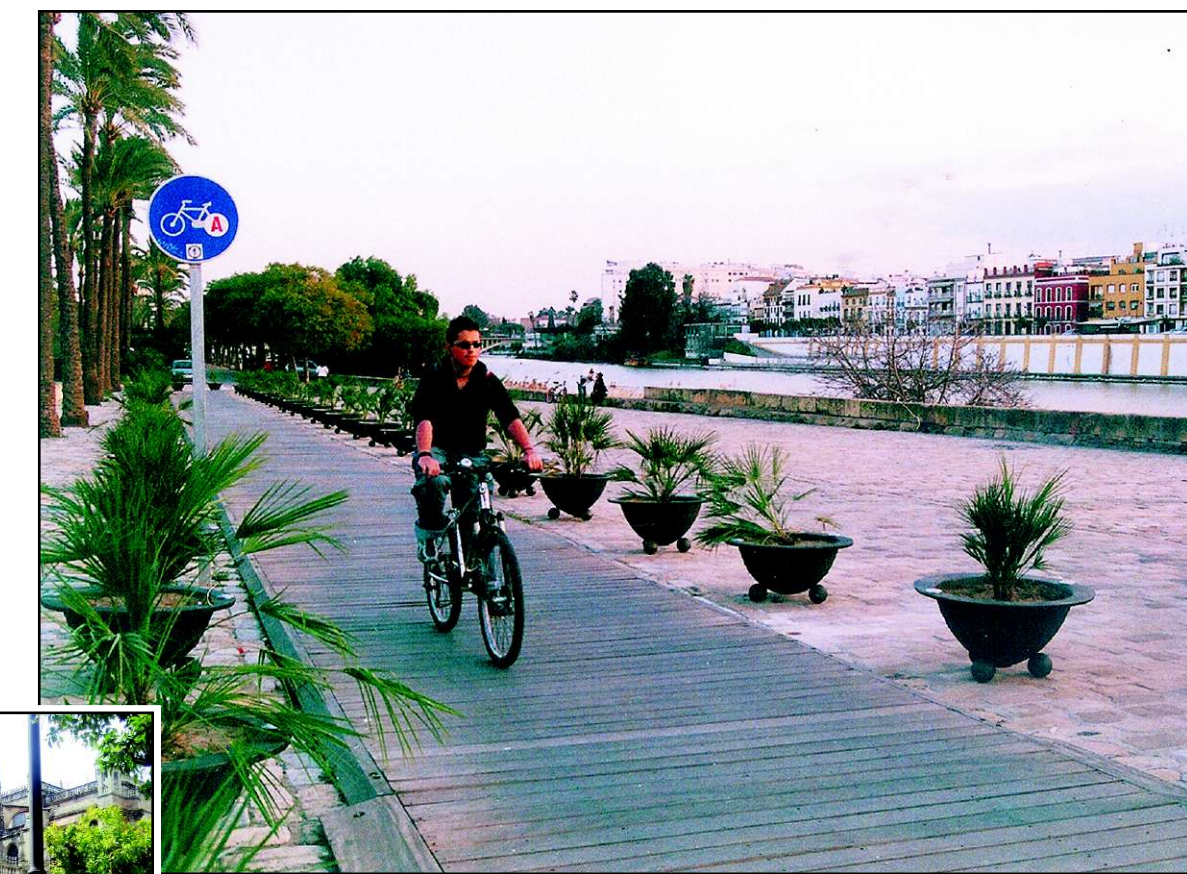
Sevilla per Fahrrad: Neue Radwege folgen dem Fluss Guadalquivir (oben), auch an der Kathedrale gibt es Abstellplätze (links)

Das öffentliche Rad ist schon jetzt ein Riesenerfolg: Im ersten