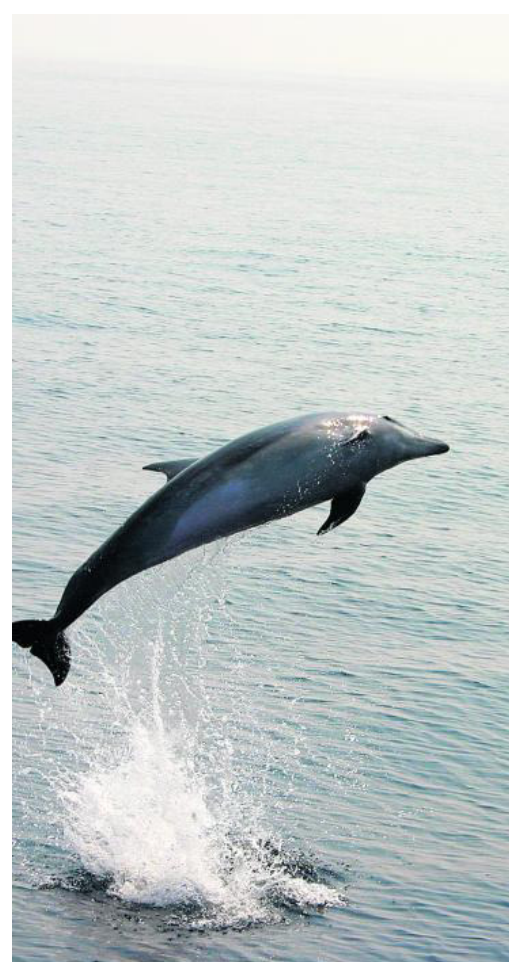
Springender großer Tümmler. :: FIRM